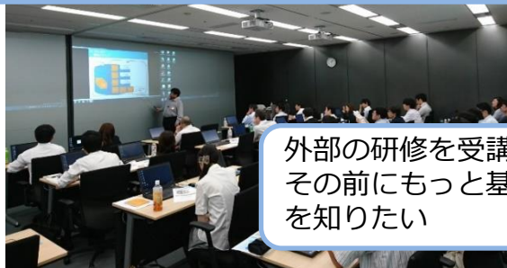
写真は過去開催時のイメージです。